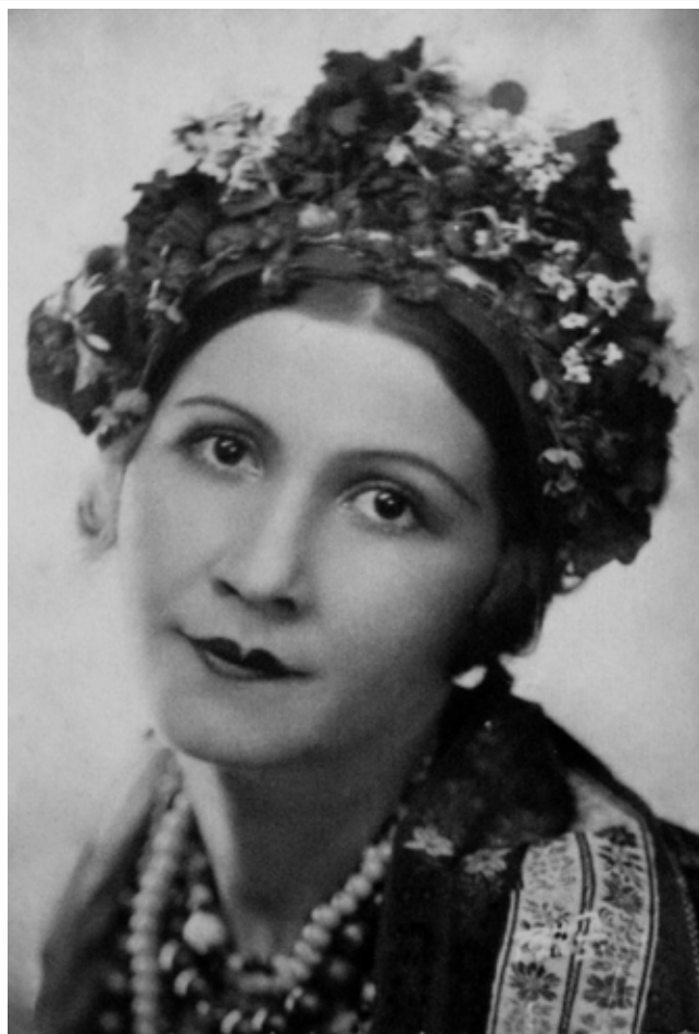
Лідія Липковська у ролі Наталки в оп. М. Лисенка "Наталка Полтавка".

Останнім часом в український музикознавчий простір все більше повертається імен, які були замовчувані чи незаслужено забуті. Однією з видатних українських співачок, що виступала на багатьох європейських і світових сценах є уродженка буковинського краю – Лідія Яківна Липковська (1884 – 1958 рр.). На жаль, до нашого часу творча постать Лідії Липковської недостатньо висвітлена дослідниками, хоча в період активного концертування її співом захоплювались та високо поцінували М.Римський-Корсаков, Ц.Кюї, Е.Направник, О.Глазунов, Ж.Массне, К.Станіславський, В.Мейєрхольд, В.Качалов, А.Луначарський, Ф.Шаляпін.