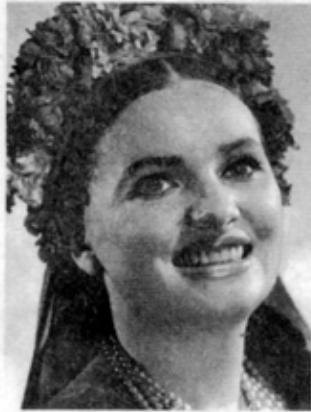
Наталка – „Наталка Полтавка” М.Лисенка, 1969 р.

У червні 1995 року за особистий внесок у збагаченні національної мистецької спадщини та висо-