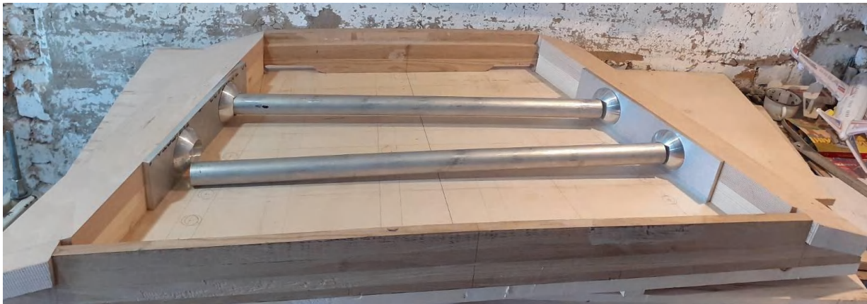
Фото 2. Карбонова рама.