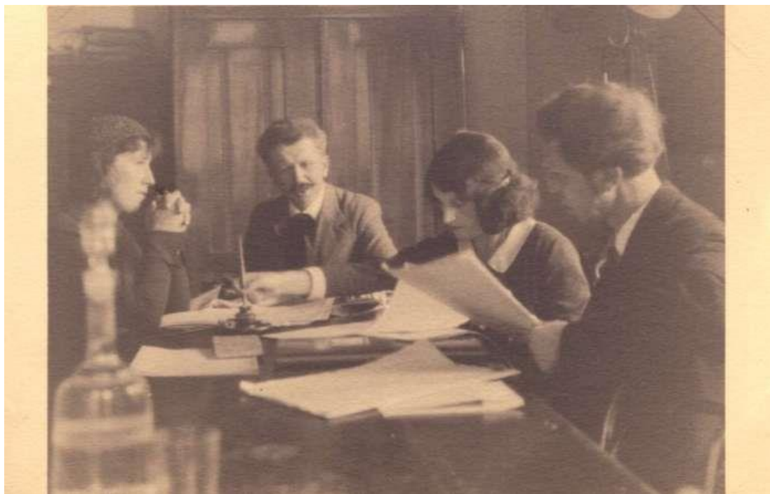
Рис. 5. Станіслав Людкевич (в центрі), Василь Барвінський у Вищому музичному інституті імені М. Лисенка у Львові, 1930-і рр.