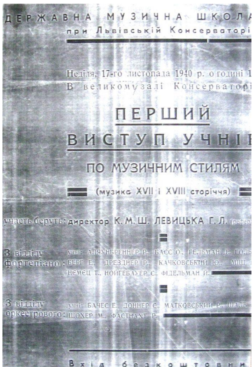
Рис.4. Афіша концерту учнів школи у 1940 р.