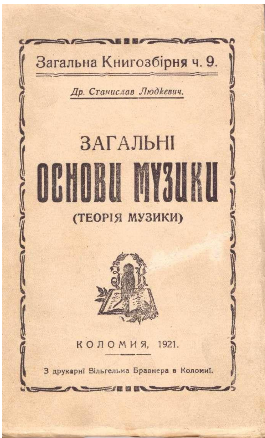
Рис.7. Підручник з теорії музики Станіслава Людкевича, 1921 рік.