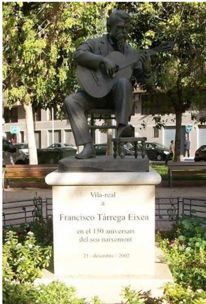
Пам'ятник Ф. Таррезі у Кастельйон-де-ла-Плані